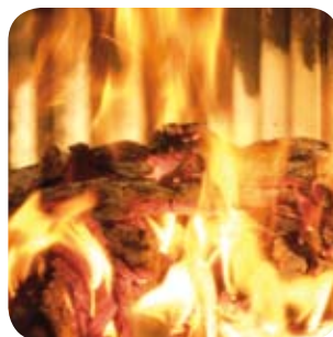
Luftzufuhr erst drosseln, wenn sich ein schöner Glutstock gebildet hat.