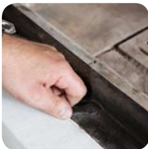
Luft- und Drosselklappen ganz öffnen.