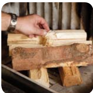
Anzündhilfe auf den Brennholzstapel legen.