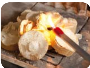
Verwendung von Holzbriketts: Briketts in Stücke zerteilen, genügend Raum zur Ausdehnung lassen und obenauf die Holzwolle platzieren.