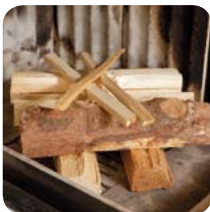
Holzspäne gekreuzt darüber platzieren.