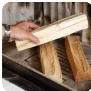
Das Holz locker in den Brennraum schichten.