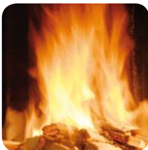
Ein kräftiges Feuer garantiert einen guten Abbrand.