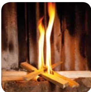
Durch ausreichend Luftzufuhr rasch helle, hohe Flammen herstellen.